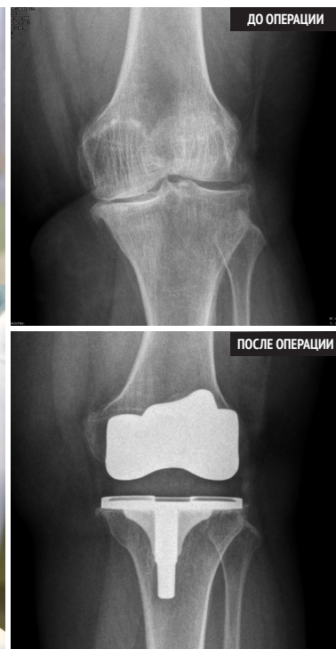
Рис. 3. Эндопротезирование коленного сустава