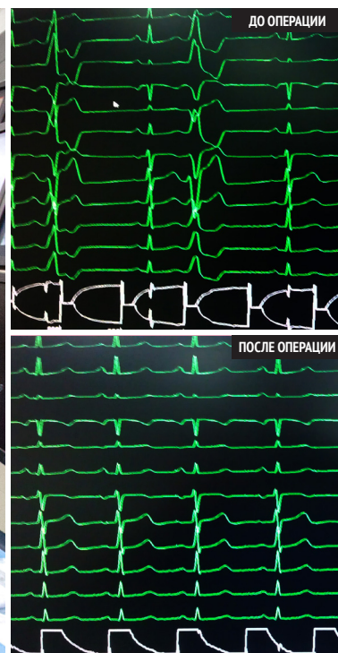
Рис. 4. Радиочастотная абляция при сложных желудочковых нарушениях ритма

эндопротезирование аневризмы почечной артерии. Достигнуты значительные успехи в интервенционном и хирургическом лечении аритмий сердца: проводится радиочастотная абляция при сложных желудочковых нарушениях ритма (рис. 4), имплантация электрокардиостимуляторов для лечения брадиаритмий пациентам с синдромом слабости синусово-